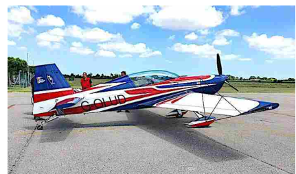
L'Extra 200 in uso all'Aero Club "Francesco Baracca" di Lugo per la scuola acrobatica