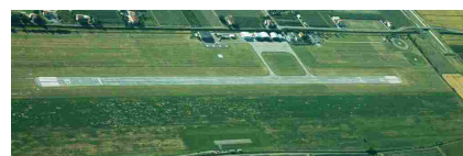
La pista dell'Aeroporto Villa San Martino di Lugo (RA), sede dell'Aero Club "Francesco Baracca" & Scuola Nazionale Elicotteri "Guido Baracca" - Lugo di Romagna Un click per ingrandire