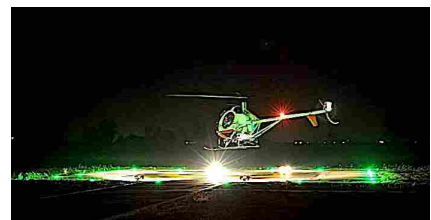
Atterraggio di uno dei due Hughes 300 C della S.N.E. nella piazzola IFR VFR dell'AeCLugo all'aeroporto di Villa San Martino di Lugo