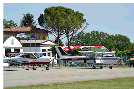
Tecnam P2008 e Cessna 172 Cutlass RG durante il Rally Aereo 2021 a Lugo