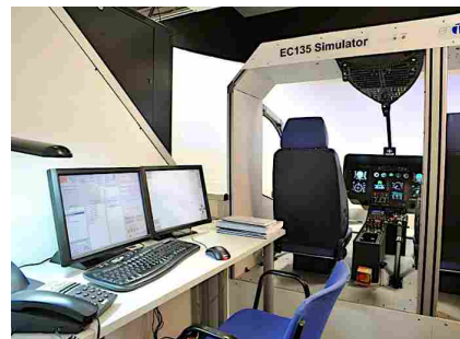
L'EC 135 Entrol Simulatore professionale dell'Aero Club di Lugo