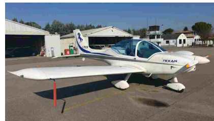
Il Texan Club 450 della Fly Synthesis per la scuola VDS e VDS avanzato