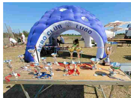
Trofei per i campioni di aeromodellismo nella Coppa d'Oro Internazionale di Lugo